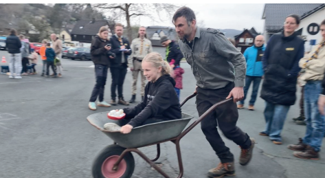
Heiße Kartoffeln aus dem Feuer und Challenges mit Spaßfaktor.